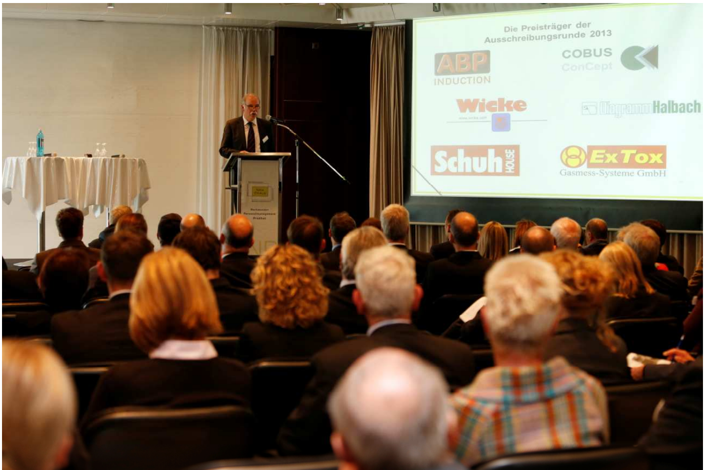
Eindrücke von der Veranstaltung