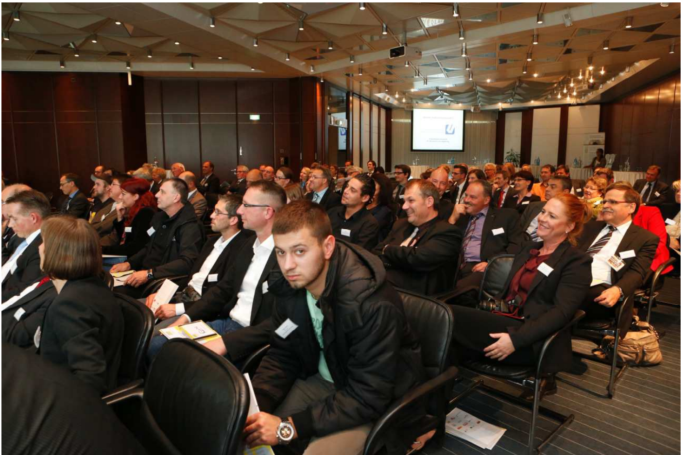
Eindrücke von der Veranstaltung