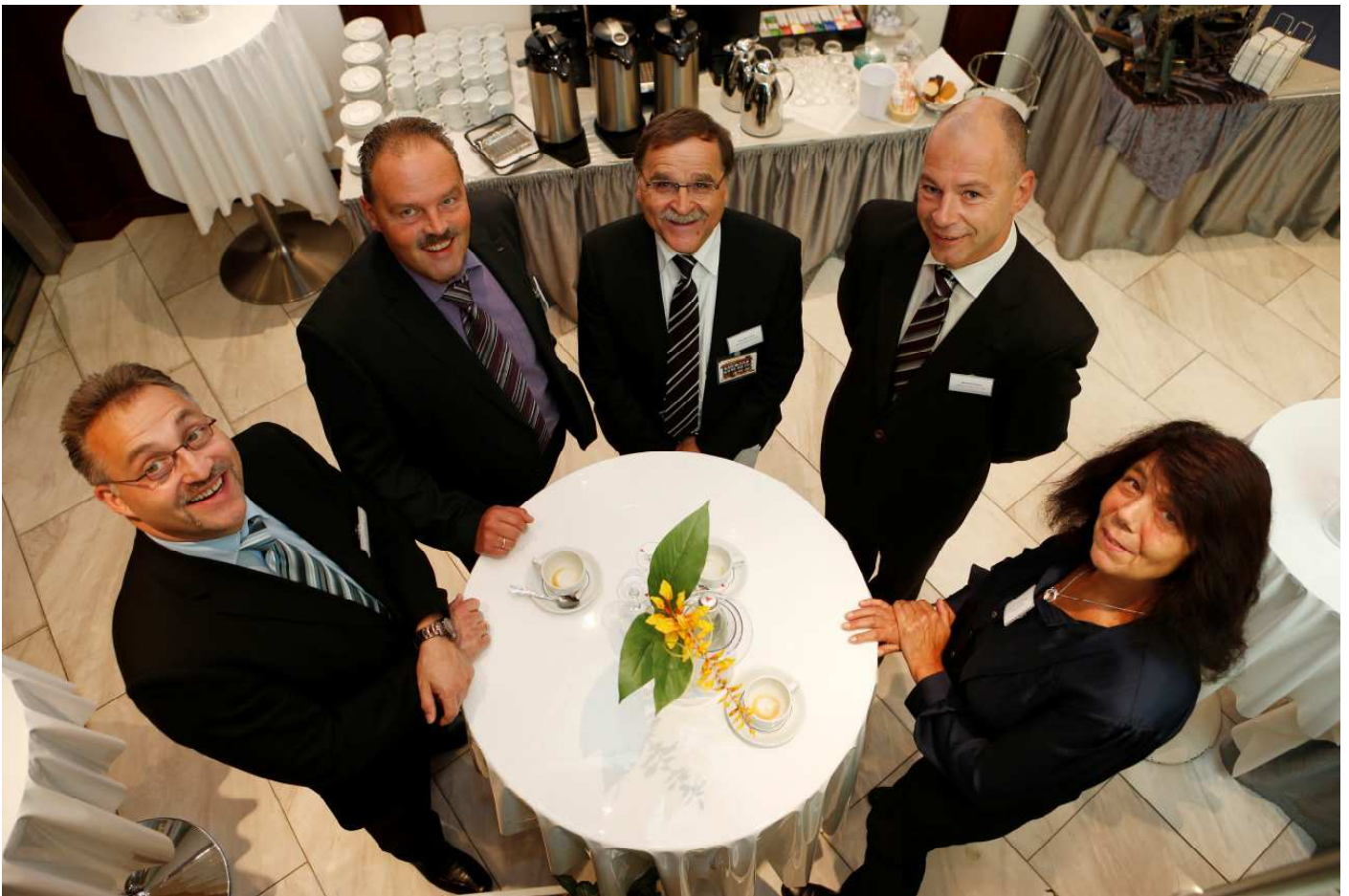
Das Wicke Ergonomie -Team vor und nach der Ehrung